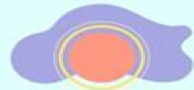
WARMTH OF THE SUN