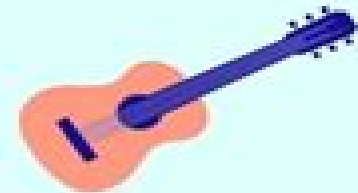
A NEW HOBBY