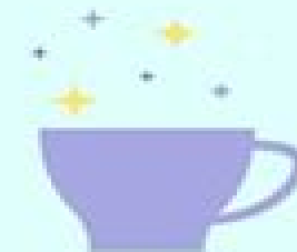
TALL CUP OF COFFEE