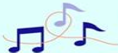
MUSIC THAT MAKES YOU DANCE