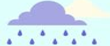
BEING INSIDE WHEN IT'S RAINING