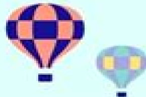
TRYING SOMETHING NEW