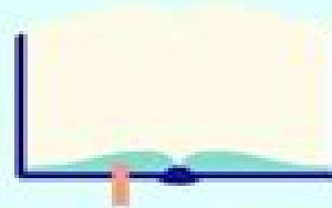
AN EPIC BOOK