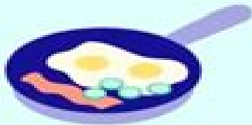
HOME COOKED MEAL